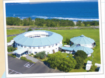
ネスト・ウエストガーデン土佐