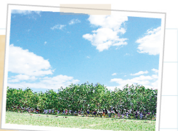
らっきょう畑と潮風のキルト展