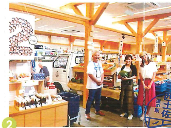
よって西土佐 道の駅 四万十川の天然をお買い物!西土佐食堂でランチ

滞在時間 10:33着~12:18発(1時間45分) ※発着時間は、前後することがあります。