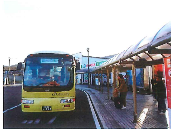
中村駅バス乗り場 (改札を出てロータリー左側)