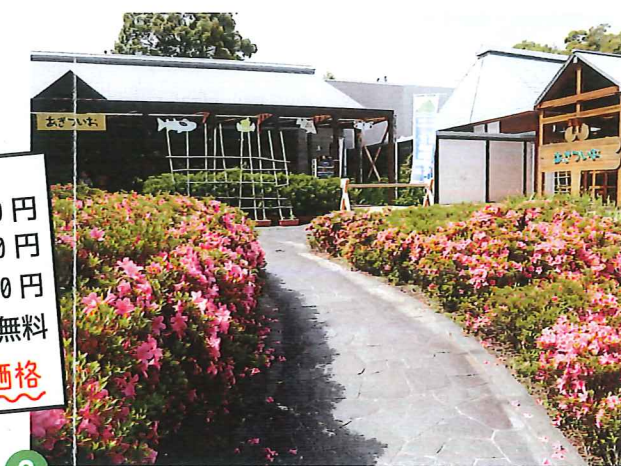
館内見学・散策(40分)