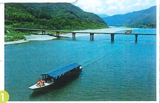
四万十川遊覧船プラン 1時間