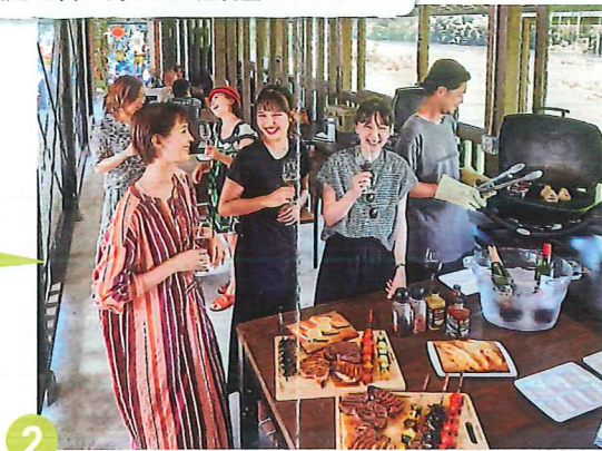
しまんとリバーサイド BBQ