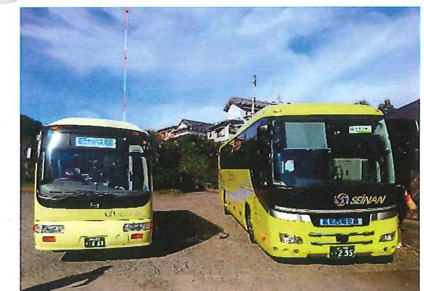
しまんとあしずり号への乗り換えができます!