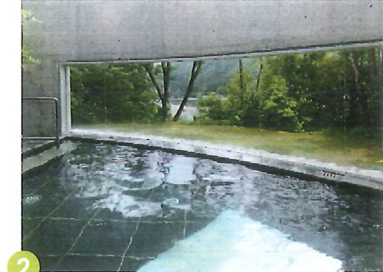
星羅四万十(日帰り入浴)