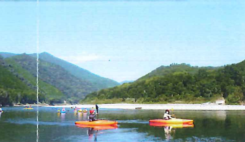
Gコース:半日カヌー6,000円~ 7人乗りメガサップもあります!